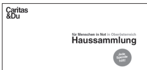
Kuvert, DIN C5/C6 (11,4 x 22,4 cm)