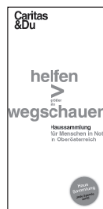
Folder für SpenderInnen, DIN lang (10 x 21 cm) passt in Kuvert DIN C5/C6