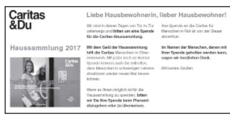
Liebe Hausbewohner, DIN lang (21 x 10 cm) passt in Kuvert DIN C5/C6