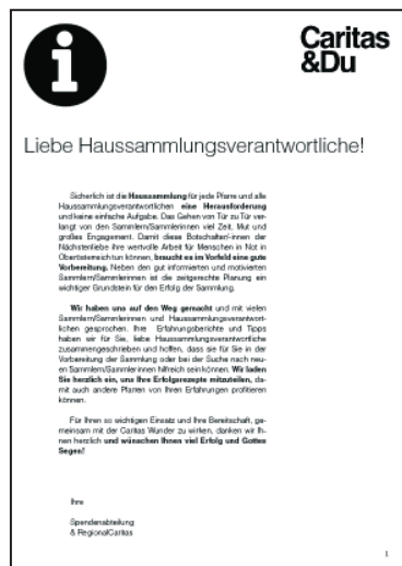
Mappe Haussammlungsverantwortliche, A4