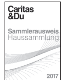
Sammlerausweis, (10,5 x 7,5)