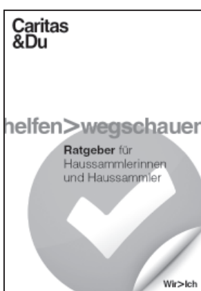
Ratgeber für SammlerInnen, A5 (21,5 x 15 cm)