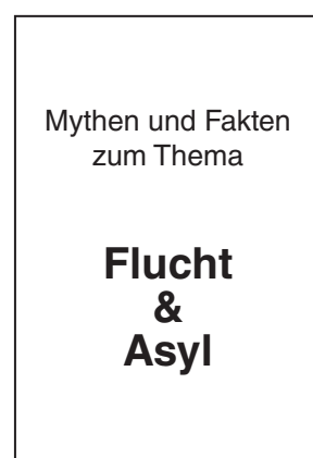
Flucht & Asyl Infobroschüre, A5 (21 x 15 cm)