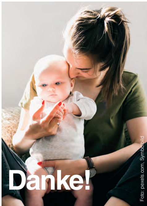
Symbolbild

Mit meiner Spende helfe ich Menschen in Not in Oberösterreich