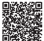
www.caritas-linz.at/spenden QR-Code mit Handy scannen

Kontakt: Caritas für Menschen in Not Kapuzinerstraße 84, 4020 Linz Tel. 0732 7610 - 2040